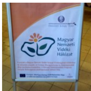
Szakmai fórum Tiszaigaron